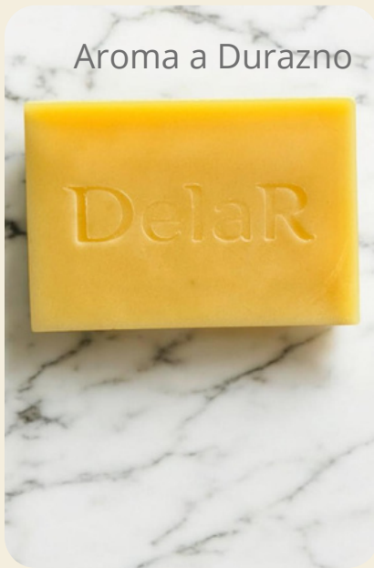
Aroma a Durazno