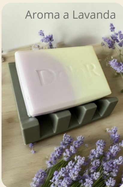
Aroma a Lavanda