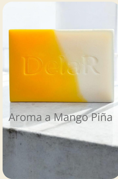
Aroma a Mango Piña