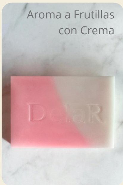
Aroma a Frutillas con Crema