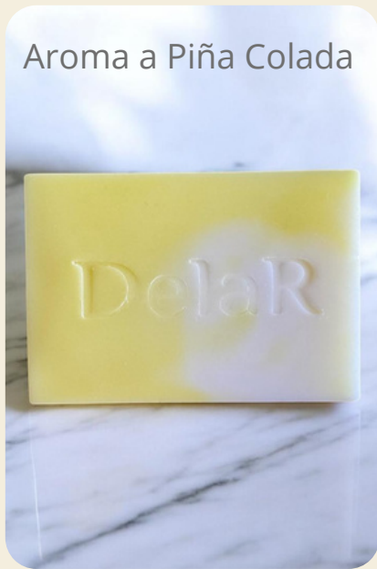
Aroma a Piña Colada

Base de glicerina con mantecas de Mango, Cacao y Karité